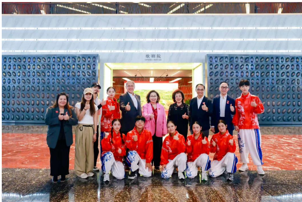
圖三：協青社代表與各機構代表合照