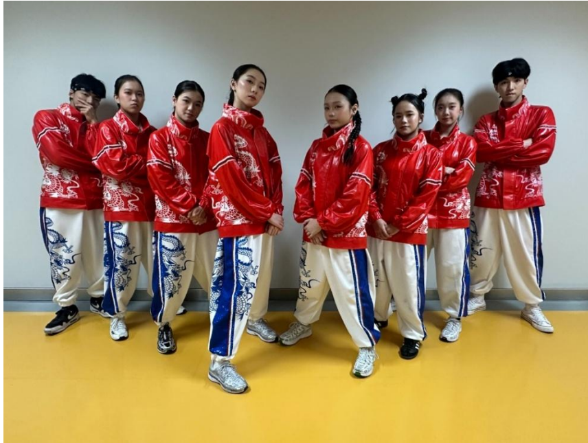
圖一：協青社 8 位青年代表