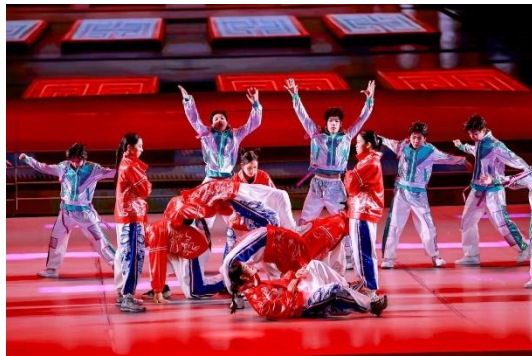
圖六至圖九：演出照片