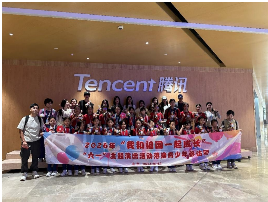
圖二：協青社與澳門婦聯學校代表合照