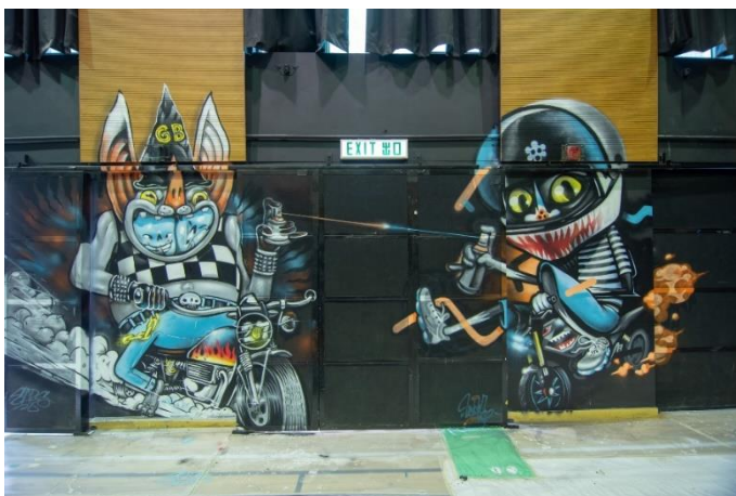
本地藝術家 uncle 與中國藝術家 Sars 在 YO 室內籃球場的共同塗鴉作品。