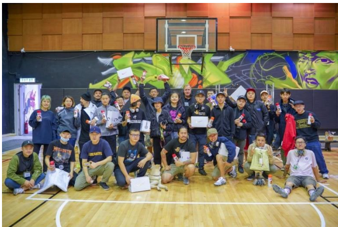
2019 Hong Kong Graffiti Jam 完成後大合照。