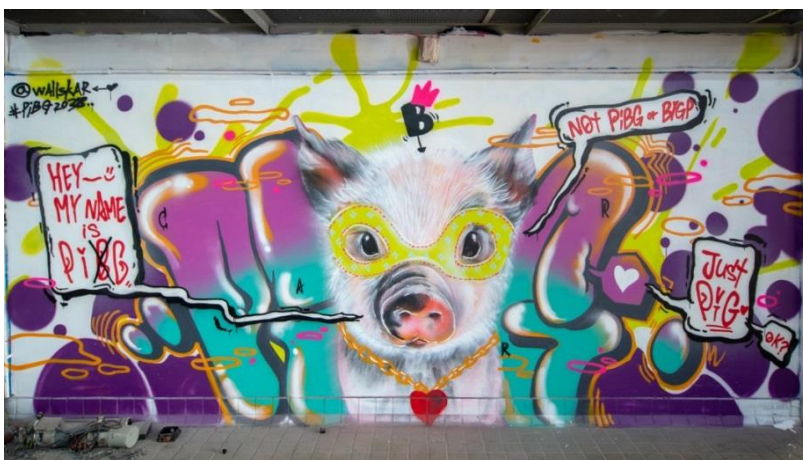
澳門鴉藝術家 Pibg 的作品。