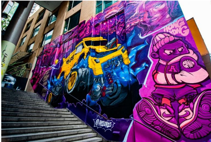
中國 AST 團隊 Milk、Gavin、Gear 及 Nilone 合力完成的作品，是整個活動最大規模的作品之一。