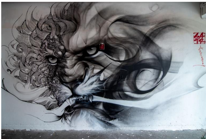
中國塗鴉藝術家 Satr 的作品。