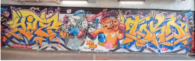
中國塗鴉藝術家 FOB Crew 的作品。